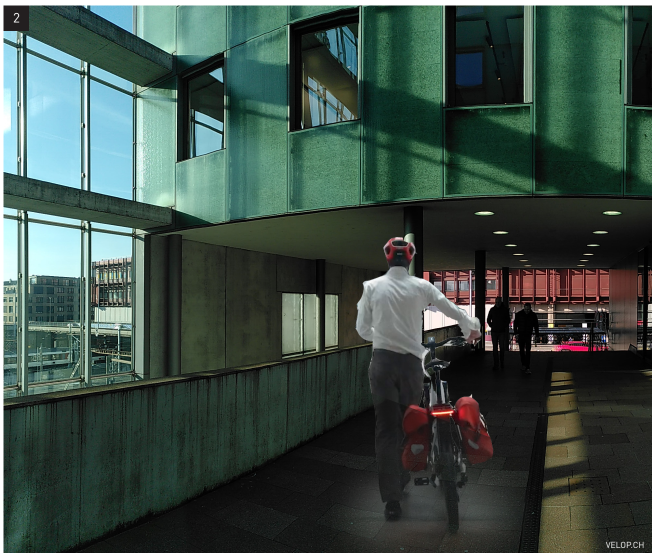
Velo mitnehmen zu Tramhaltestelle und Firmeneingängen PM 82-90.